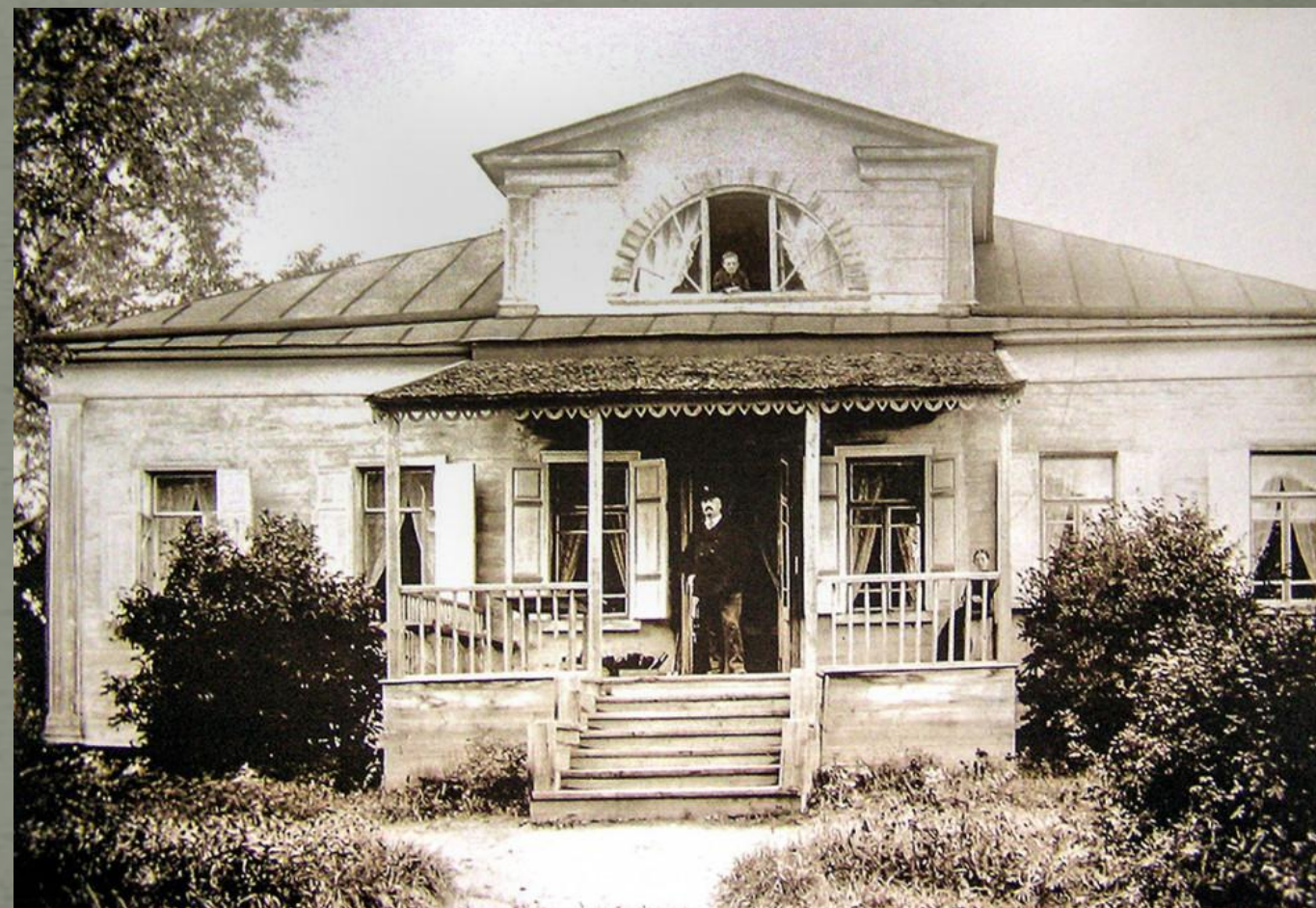
Усадебный дом в "Шахматово". 1894 год.