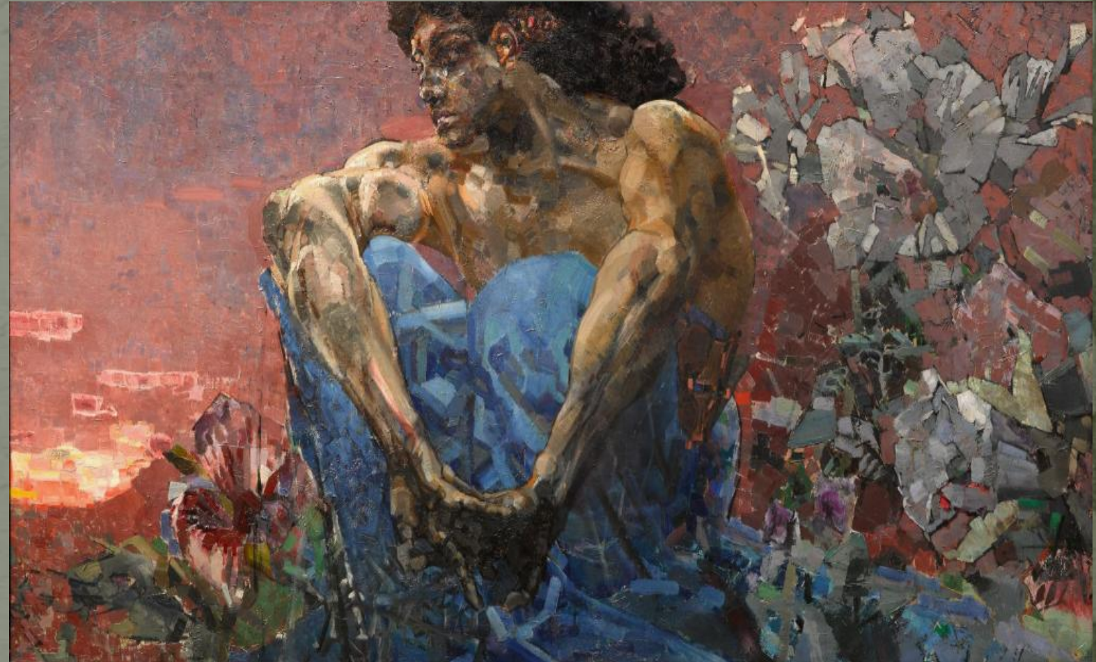
Михаил Врубель «Демон сидящий» , 1890 г.