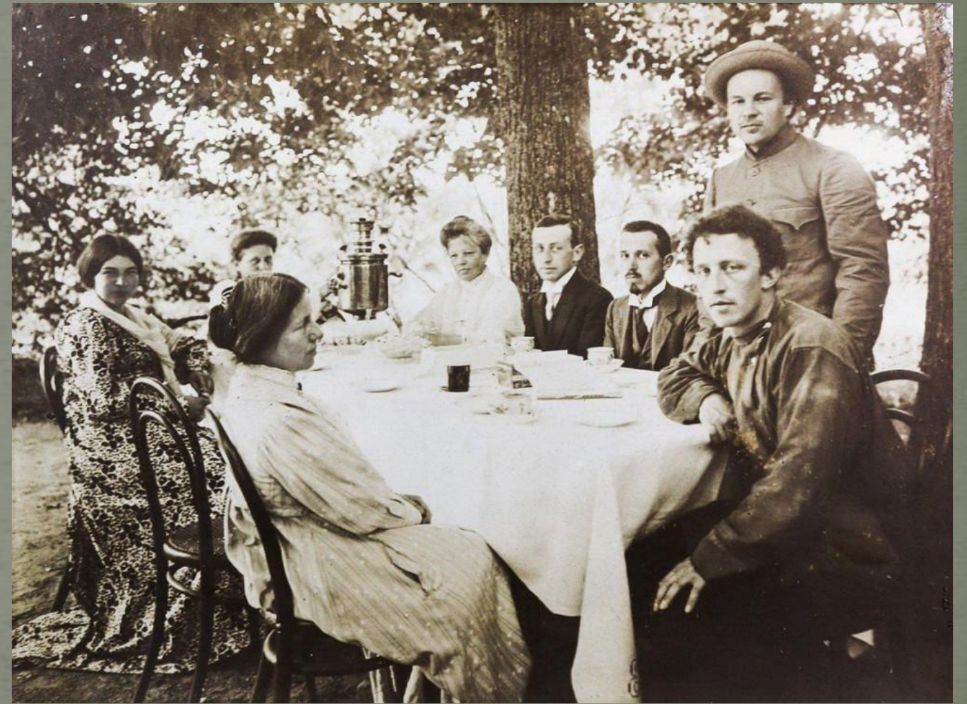
Шахматово. Чаепитие под липами. Александр Блок (справа) и его родные. 1909 год.