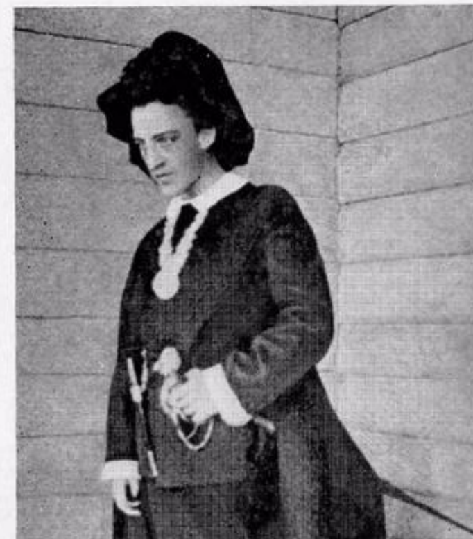
Александр Блок в роли Гамлета («Гамлет» Шекспира). Фотография. 1898.