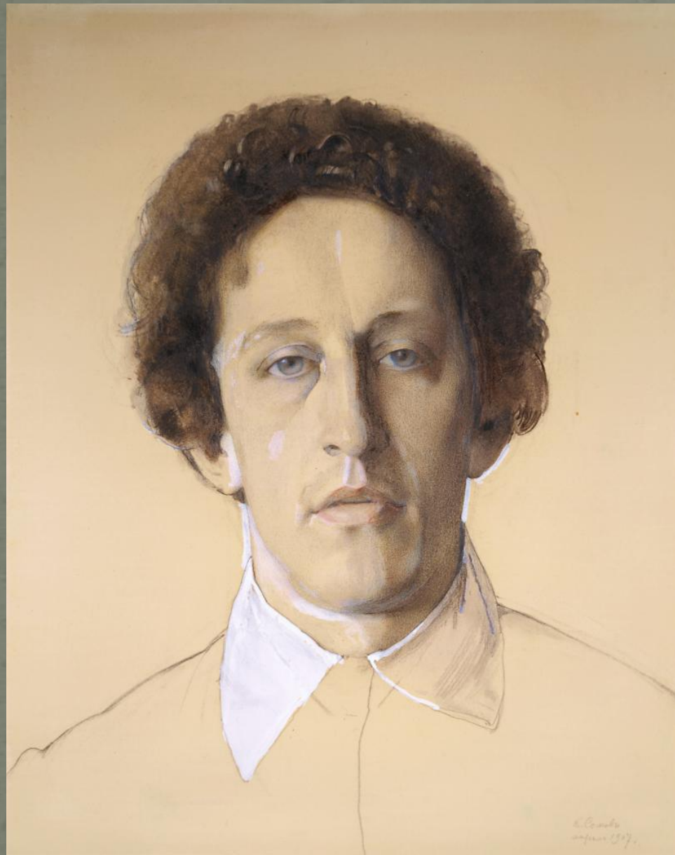
Сомов К.А. Александр Блок. М., 1907.

Александр Александрович Блок (1880-1921) – один из крупнейших русских поэтов XX века, ключевая фигура Серебряного века. Символист, оказавший огромное влияние на русскую литературу.